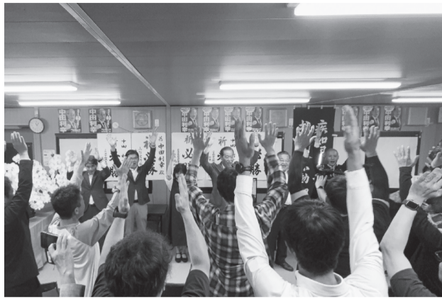
支援者と当選の喜びを分かち合った