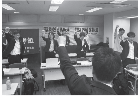
新たな分会体制の門出となった 第33回営業系統分会定期大会

みなさんは営業系統分会を存続でしょうか。財務部を分會などと同様、本社総支部発足時から続く分会の一つで、営業関係部署を中心に30年以上の歴史を重ねてきました。2020年頃には、営業本部(当時)、CS推進部(当時)、CS推進部(当時)が構成されていまし