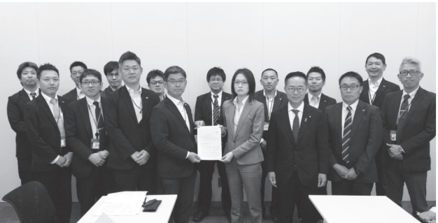
鉄道を取り巻く各種課題の解決に向け、議論の深掘りを要請

我々の産業や生活には、労働関係だけでは解決できない課題があることを認識し、これら現実を直視し、政治への理解を深める取り組みを進めるとともに、JR西労組の政策課題に賛同する国会議員や地方議員を増やしていく運動を積極的に展開する。