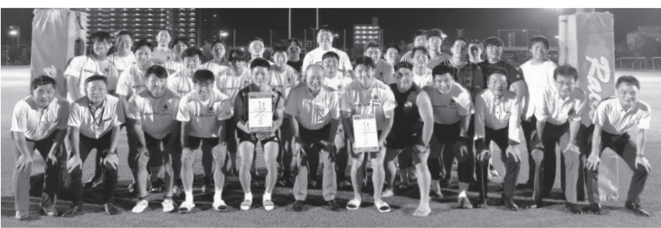
頼もしいレイラーズを激励

JR西日本レイラーズは、今シーズンのスローガンを、他者と比較せずに自分たちが進むべき場所に向かって、新しい線路を淡々と敷き続けるという意味を込めた「RAIL」とし、日々の業務との両立を行いながら、練習に臨んでいる。