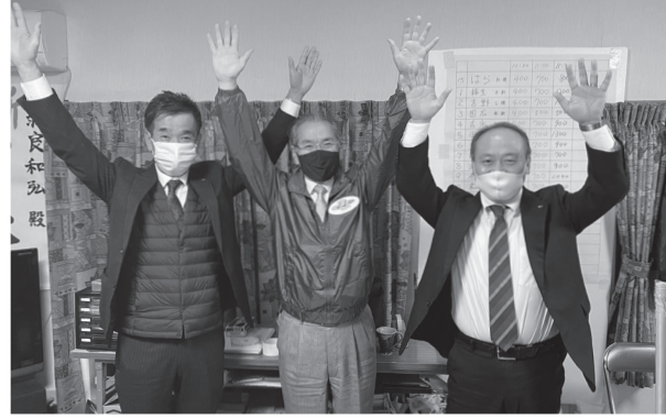
激戦を制し3期目の当選を勝ち取った羽良氏(中央)