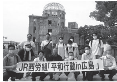
広島平和記念資料館では8月6日の惨状や放射能による被害や核兵器の危険性など見聞を広め、ピースウォークでは、平和記念公園内の平和にまつわる場所をめぐり、広島地本青年女性委員会の組合員がそれぞれの碑や施設の説明をおこなった。あわせて翌日の国鉄原爆死没者慰霊式にも参列。密をさけながら縮小で開催し、鉄道員の先輩方に哀悼の意を捧げた。これからも戦争や原爆の歴史を風化させない行動を、JR西労組として取り組む。

中央本部は広島地方本部と共に、8月1日(土)・2日(日)開催された連合「平和行動in広島」に14名が参加した。