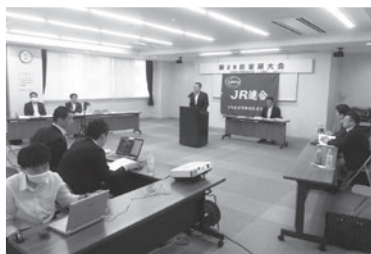
組織、産業・労働政策などについて挨拶を行う荻山会長