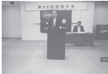
制度要求、組織課題などについて、意見書を提出し課題提起と方針への補強を行った。

JR連合は、いま直面している新たな困難と、今後劇的に変化する社会を真正面から受け止めつつ、組織の総力を結集して未曾有の困難を乗り越えるために、