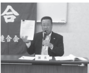
議長に松原副委員長(JR西労組)が選出された

JR西労組からは、事前に配布された議案書等の資料を確認し、代議員の意見を取りまとめ、新型コロナウイルス感染症拡大への対応、安全の取り組み、政策