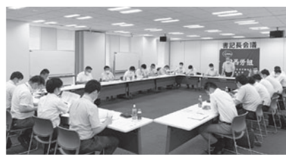
労働協約改訂交渉などの議論を行なった