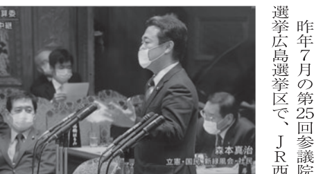
緊急事態対応での現状の課題について発言する森本真治参議院議員