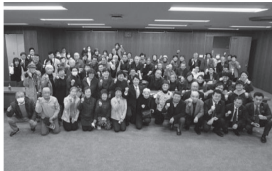
広島地本、地元支援者を含め総勢100名が議会を傍聴