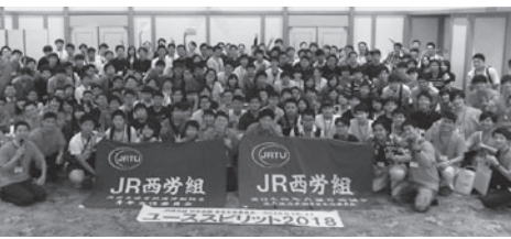
「絆が深まる安芸の国」に総勢175名が集結

緊張をほぐすため、自己紹介ゲームなどを行った。その後、21チームに分かれ、広島市内を巡るチーム対抗のウォークラリーを行った。広島市内だけでなく宮島も行動範囲に含め、チームで相談してルートを選定する仕掛けをした。宿泊所の世羅別館では交流会を行い、チームの絆を越えて語り合うなど大いに盛り上がった。