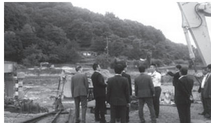
国会議員懇談の6名が 西日本豪雨の被災地を視察

9月14日、西日本エリア選出を中心とする、JR連合国会議員懇談会の議員6名が、西日本豪雨で被害を受けた広島支管内の被災線区を視察した。7月の災害から2か月余りが経過し、組合員の懸命な尽力により、復旧された箇所もある一方で、未だに復旧の目途が立たず、被害の大きさを目の当たりにした。あわせて、JR連合・JR西労組としての政策要望を伝え、治山・治水をはじめとする災害に強い鉄道づくりや、バス代行輸送への助成制度の新設など、災害に関連する内容について要望を行った。