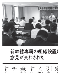
新幹線専属の組織設置について意見が交わされた

また、本会議で集約された組合員の意見をもとに、翌日の26日には、申22号「新幹線専属の組織（新幹線鉄道事業本部）の設置」について、会社と協議を行った。