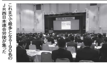
第10回女性に関する学習会 各地本から24名の女性が出席