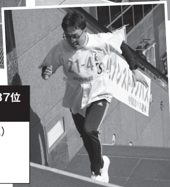
尼っ子かけあがり隊 37位 (ジェイアール西日本商事労働組合) 2分40秒89