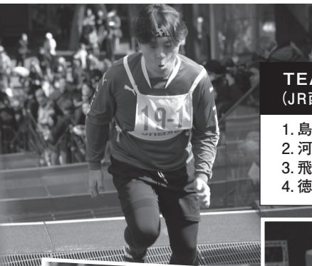
TEAM TECHSIA 36位 (JR西日本テクシア労働組合) 2分40秒88