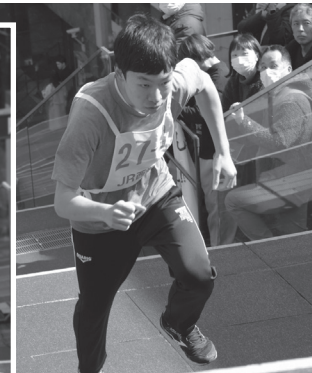
Go up the Stairs 73位 (西日本ジェイアールバスサービス労働組合) 3分34秒03