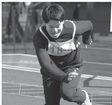
大鉄陸上部 28位 (大鉄工業労働組合) 2分32秒05