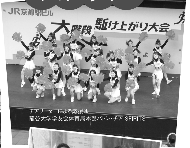
チアリーダーによる応援は 龍谷大学学友会体育局本部/トク・チア SPIRITS