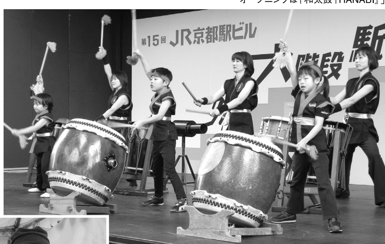
オープニングは「和太鼓「HANABI」」