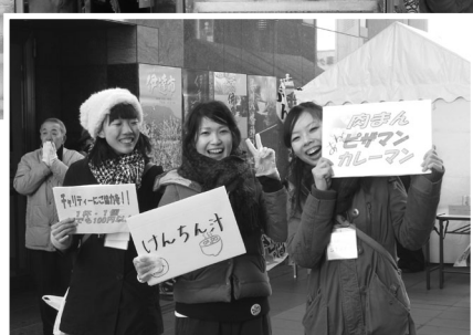
「あったかいけんちん汁いかがですか〜」 募金コーナーの受け持ちは京都地本青女の皆さん