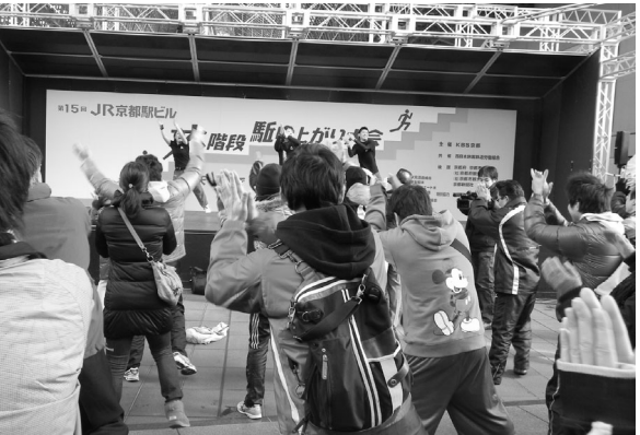
準備体操は「ウェルネスクラブ オーク21」の指導で