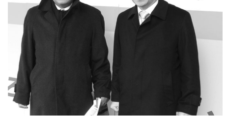
応援に駆けつけた三日月衆議院議員