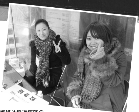
救護班は鉄道病院の 看護師の皆さん