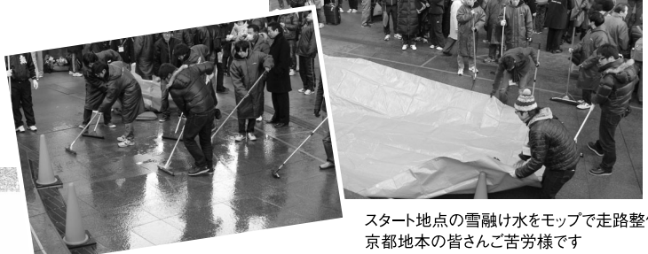
スタート地点の雪融け水をモップで走路整備 京都地本の皆さんご苦労様です