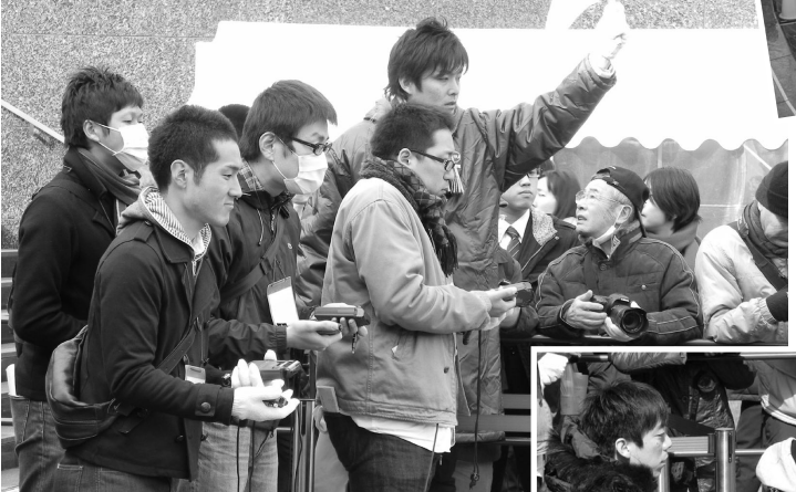
ゴール地点集計 ご苦労様